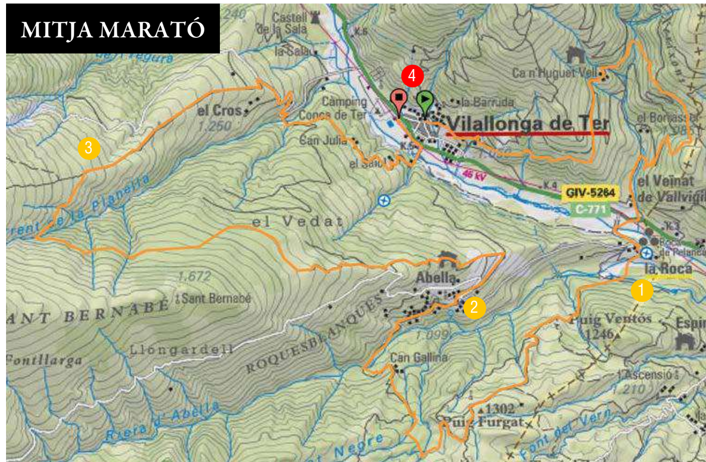
Gràfica i avituallaments de la Marató

Altura màxima: 1.604,71 m - Desnivell positiu: 2545,48 m - Distància: 42 km