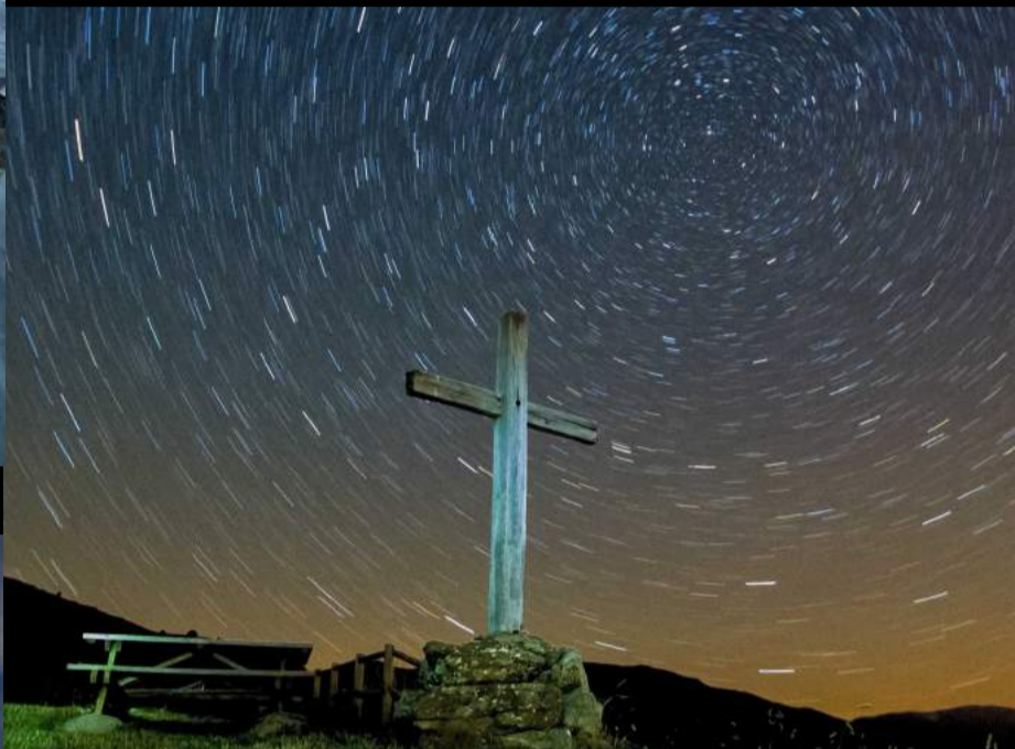
XIVa edició— Primer Premi Paisatge. Manel Sánchez—La creu i les estrelles