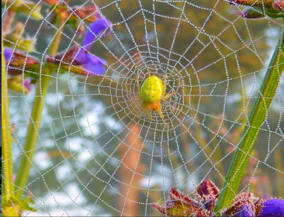
XIVa edició— Primer Premi Flora i Fauna. Antònia Coromina –Aranya amb teranyina de perles .