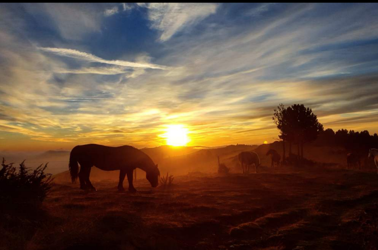
XIVa edició— Premi Especial: Votació Facebook. Pau Molas—Trenc d'alba de tardor.